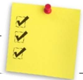
TABLEAU SYNTHÈSE FRAIS DU SERVICE DE GARDE